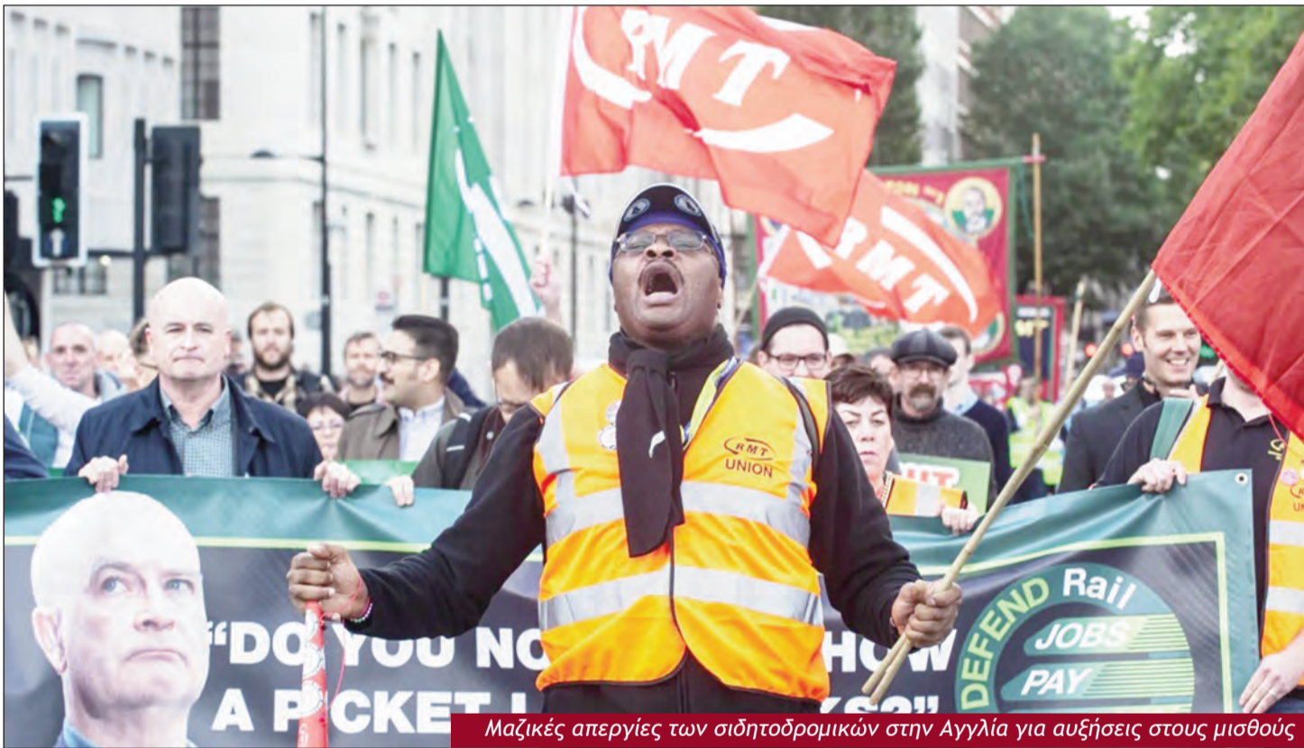
Μαζικές απεργίες των σιδητοδρομικών στην Αγγλία για αυξήσεις στους μισθούς

Σ αν περίπου ...φυσικό φαινόμενο παρουσιάζει η επίσημη πολιτική φιλολογία την ακρίβεια που καλπάζει και εξαθλιώνει τον λαό. Σαν μια κατάσταση που δεν έχει κοινωνικές, ταξικές, πολιτικές αιτίες, σαν μια κατάσταση που «έρχεται απ' έξω», από κάποιο ...χαμηλό βαρομετρικό που απρόσμενα δημιουργήθηκε και την οποία ο λαός πρέπει να την υποστεί αδιαμαρτύρητα! Ταυτόχρονα, κανείς βέβαια δεν λέει ποτέ θα «ξεθυμάνει το χαμηλό βαρομετρικό» που όλο και φορτώνει και πολύ περισσότερο τι φέρνει το «φόρτωμά του» στον λαό μας, στους λαούς.