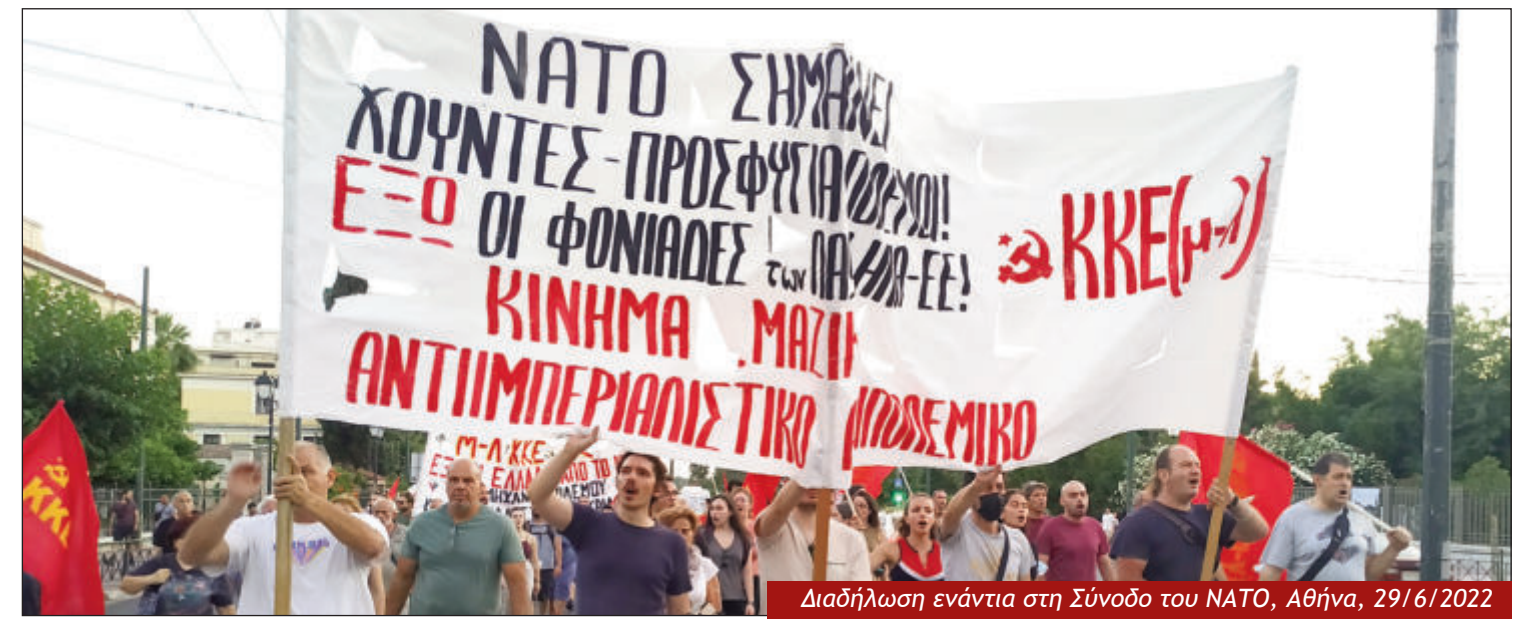
Διαδήλωση ενάντια στη Σύνοδο του ΝΑΤΟ, Αθήνα, 29/6/2022

Η σημασία και η κρισιμότητα της Συνόδου, η επίτευξη και προώθηση των βασικών της στόχων ξεκαθαρίστηκαν από τις ΗΠΑ και στις δύο πλευρές και από ό, τι φαίνεται έγιναν κατανοητές πριν τη διεξαγωγή της, ακόμη και όταν ο ντόπιος αστικός τύπος εμφάνιζε τον «ταραξία» και «τραμπούκο» Ερντογάν έτοιμο να τινάξει στον αέρα τη Σύνοδο, αλλά και τον Μητσοτάκη «οπλισμένο σαν αστακό» έτοιμο να αντιπαρεθεί στις τουρκικές προκλήσεις. Τελικά, από εκεί που Αθήνα και Άγκυρα έπαιρναν θέσεις μάχης έτοιμες να μετατρέψουν τη Σύνοδο σε ρινγκ των ελληνοτουρκικών διαφορών, αυτή τη φορά και οι δυο πλευρές, σαν καλά παιδιά, υπηρέτησαν τις ανάγκες των ιμπεριαλιστικών αφεντικών, συμβάλλοντας στην «επιτυχία» της Συνόδου και στην «ενδυνάμωση της Συμμαχίας», χωρίς να ακουστεί το παραμικρό.