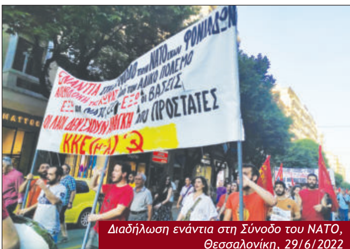
Διαδήλωση ενάντια στη Σύνοδο του ΝΑΤΟ, Θεσσαλονίκη, 29/6/2022