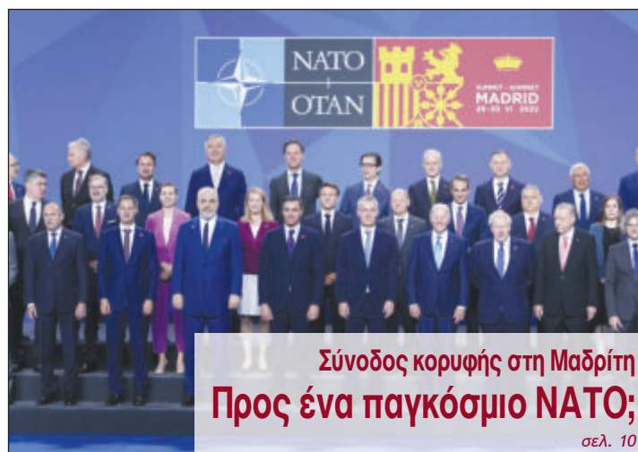
Σύνοδος κορυφής στη Μαδρίτη Προς ένα παγκόσμιο ΝΑΤΟ;