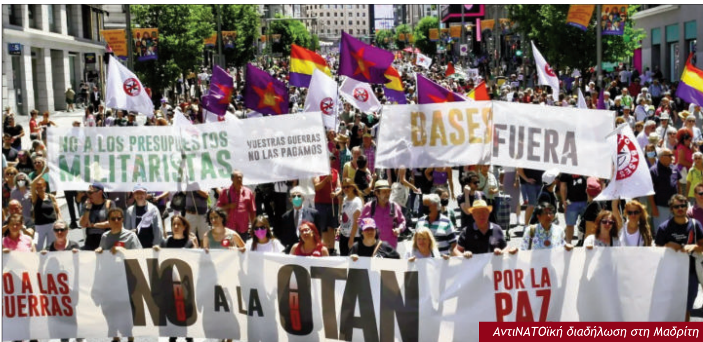
ΑντιΝΑΤΟϊκή διαδήλωση στη Μαδρίτη

Σ ε αναταραχή διαρκείας βρίσκονται τα κόμματα και τα κέντρα του συστήματος στη χώρα. Μια αναταραχή που οι πηγές της και οι αιτίες της βρίσκονται έξω από τη χώρα και οπωσδήποτε δεν ελέγχονται από τους ντόπιους ιθύνοντες. Μια αναταραχή που «ξεκινά» από τη χαινουσα ουκρανική πληγή, την οποία άνοιξε η ιμπεριαλιστική σύγκρουση και για την οποία, όπως ανέδειξε η σύνοδος των δολοφόνων του ΝΑΤΟ στη Μαδρίτη, οι ΗΠΑ αναζητούν όρους συνέχισης, κλιμάκωσης, διάχυσης. Αυτή η γραμμή της συνέχισης και έντασης του πολέμου που προωθούν και επιβάλλουν οι ΗΠΑ προκαλεί τριγμούς, αναστατώσεις και κρίσεις σε όλα τα επίπεδα, στους συμμάχους τους Ευρωπαίους ιμπεριαλιστές, στην περιοχή και σε όλο τον κόσμο. Αυτή η γραμμή, και όσα αυτή προκαλεί στην Ευρώπη και την περιοχή,