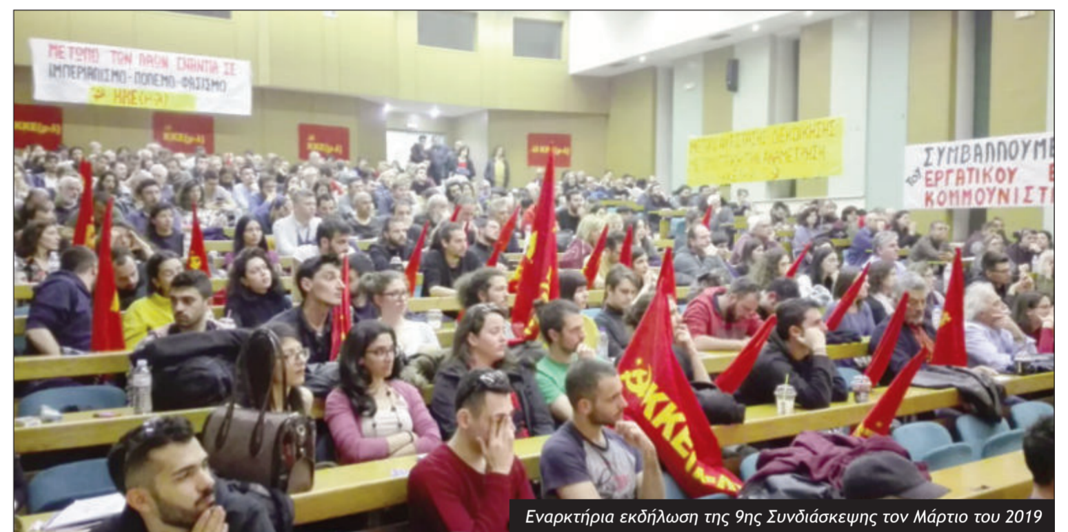
Εναρκτήρια εκδήλωση της 9ης Συνδιάσκεψης τον Μάρτιο του 2019

Χαρακτηριστικές πλευρές της κυβερνητικής πολιτικής αυτή την περίοδο ήταν: Η εγκατάλειψη του λαού στο έλεος του ιού, με την πεισματική άρνηση να πάρει ουσιαστικά μέτρα στα νοσοκομεία και στους χώρους εργασίας για την προστασία της υγείας και της ζωής του. Τα lock down, οι απαγορεύσεις μέχρι του επιπέδου της αντισυνταγματικότητας, η αστυνομοκρατία, το ξύλο, οι συλλήψεις, γενικά μια σειρά ενέργειες που επιδίωκαν να εμποδίσουν στη συνειδηση του λαού και της νεολαίας την αντίληψη της υπακοής και της υποταγής και να επιβάλλουν «οιγή νεκροταφείου». Η επιτάχυνση της επίθεσης σε όλα τα μέτωπα, στο μέτωπο της εργασίας με τις «προσωρινές» αντεργατικές ρυθμίσεις για αναστολές εργασίας, τηλεργασία κ.λπ. και τον ν. 4808/21 (Χατζηδάκη), στην εκπαίδευση με τον ν. 4692/20 (πολυνομοσχέδιο) και τον ν. 4777/21 (Κεραμέως-Χρυσοειδή) και στα δημοκρατικά δικαιώματα με τον ν. 4703/20 που απαγορεύει