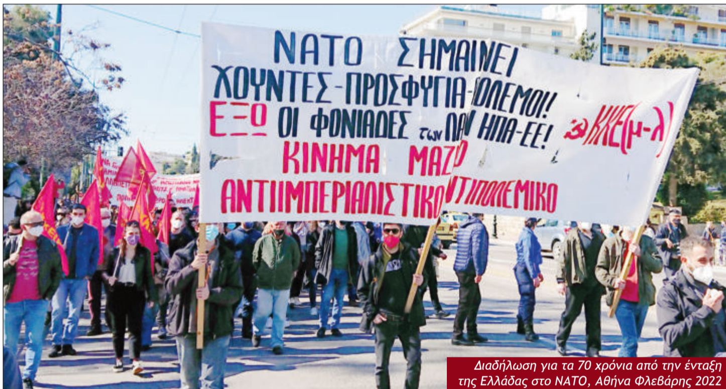
Διαδήλωση για τα 70 χρόνια από την ένταξη της Ελλάδας στο ΝΑΤΟ, Αθήνα Φλεβάρης 2022

ενάντια στην εξαθλίωση, τον άδικο πόλεμο και την ιμπεριαλιστική εξάρτηση