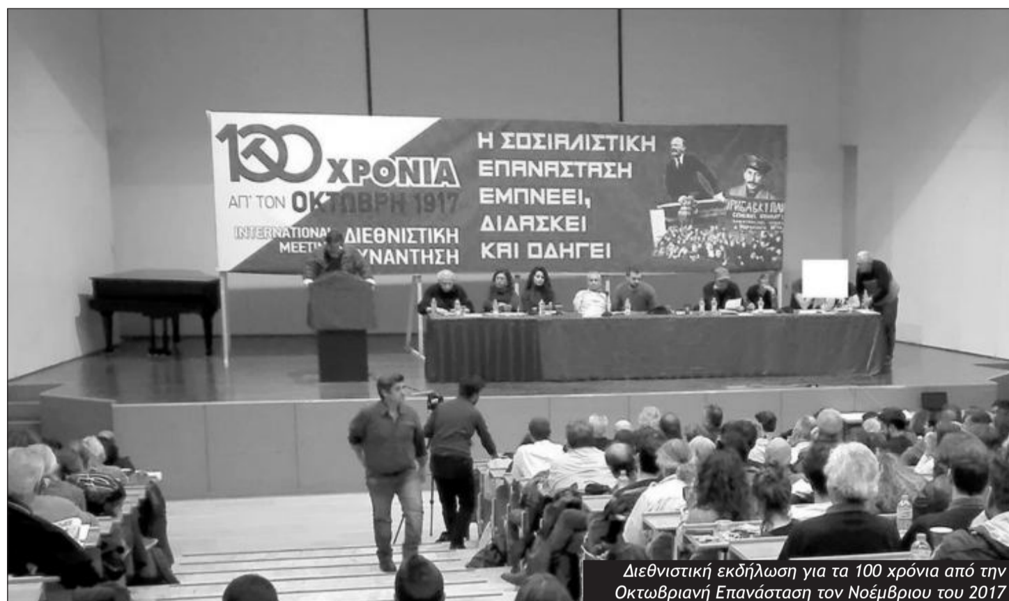
Διεθνιστική εκδήλωση για τα 100 χρόνια από την Οκτωβριανή Επανάσταση τον Νοέμβριο του 2017

νται από ισχυρές αστυνομικές δυνάμεις και συλλαμβάνονται έξω από το βιβλιοπωλείο. Εναντίον τους εκκρεμεί πολιτική δίκη, παρά την απόσυρση των κατηγοριών σε αρκετούς άλλους αγωνιστές που είχαν συλληφθεί εκείνη την ημέρα στην Αθήνα.