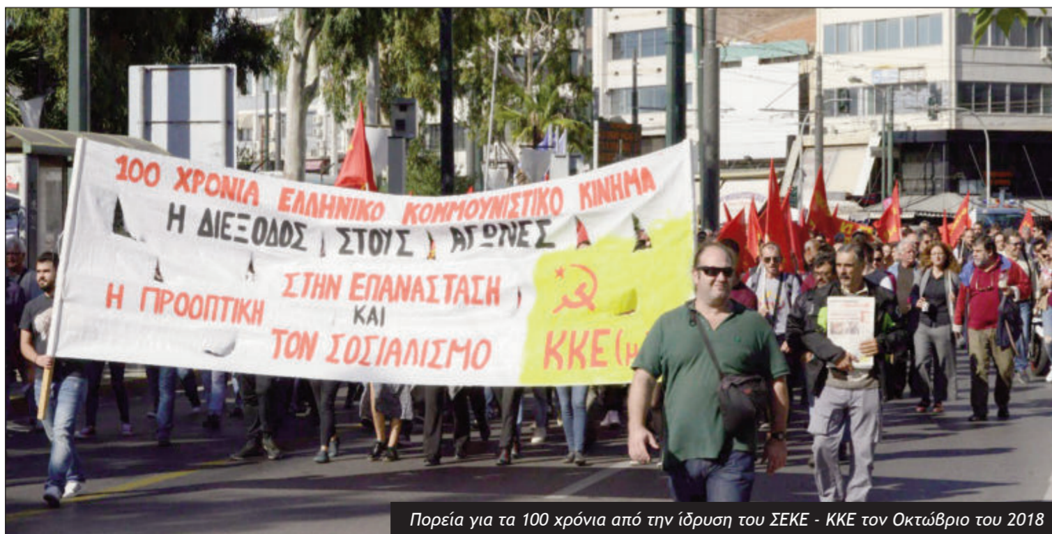
Πορεία για τα 100 χρόνια από την ίδρυση του ΣΣΕΚ - ΚΚΕ τον Οκτώβριο του 2018

Η επόμενη αντίστοιχη μάχη ήταν στις 6 Δεκέμβρη, στην επέτειο της δολοφονίας του Γρηγορόπουλου. Ξανά το ίδιο σκηνικό απαγόρευσης και τρομοκρατίας, μόνο που αυτή τη φορά η Αθήνα και οι περισσότερες πόλεις της χώρας ήταν στην κυριολεξία αστυνομοκρατούμενες, με απαγόρευση κάθε κίνησης ακόμη και ενός ατόμου. Η οργάνωση στην Αθήνα (και σε άλλες πόλεις) επιχειρεί να κάνει συγκέντρωση, τα ΜΑΤ προσπαθούν να εισβάλουν στο βιβλιοπωλείο «Εκτός των τεχνών» και τελικά 12 στελέχη του ΚΚΕ(μ-λ) μαζί με τον Γραμματέα της Οργάνωσης περικυκλώνο-