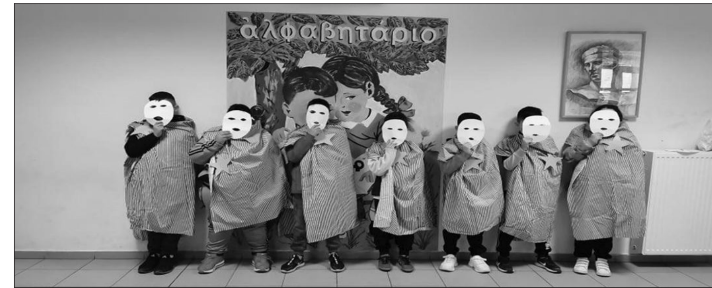
Μαθητές του 5ου Διαπολιτισμικού Σχολείου συμμετέχουν στην πεντάλεπτη περφόρμανς με τίτλο «Τα παιδιά του Κόρτσακ στο Άουσβιτς» για την γενοκτονία των Εβραίων, με αφορμή την Ημέρα Μνήμης του ολοκαυτώματος, το 2021

Να αποσαφηνίσουμε τον όρο κοινωνικός αποκλεισμός γιατί δεν χρησιμοποιείται από όλους τους ανθρώπους με τον ίδιο τρόπο. Επιλέγω να χρησιμοποιώ τον όρο κοινωνικός αποκλεισμός ως παρεμπόδιση απορρόφησης κοινωνικών και δημόσιων αγαθών η έλλειψη των οποίων συνήθως οδηγεί στη φτώχεια και την περιθωριοποίηση. Οι Ρομά είναι κοινωνικά αποκλεισμένοι επειδή αντιμετωπίζουν εμπόδια στο να απολαμβάνουν κοινωνικά αγαθά όπως είναι η εκπαίδευση, η υγεία, η στέγαση, η εργασία. Τα εμπόδια αναφέρονται σε θεσμοθετημένα μέτρα ή/και στάσεις, αντιλήψεις, συμπεριφορές σε