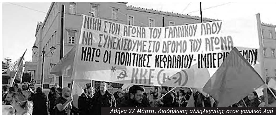
Αθήνα 27 Μάρτη, διαδήλωση αλληλεγγύης στον γαλλικό λαό

Με αυτή τη γραμμή της ωμότητας ο Μητσοτάκης επιδιώκει το έγκλημα του συστήματος στα Τέμπη να το διαστρέψει σε αφετηρία νέων χτυπημάτων των δικαιωμάτων του εργαζόμενου λαού! Με την ίδια γραμμή η «αντιπολίτευση» του ΣΥΡΙΖΑ αρνείται ακόμα και τη λέξη «σεισάχθεια» που είχε πει στον προ-