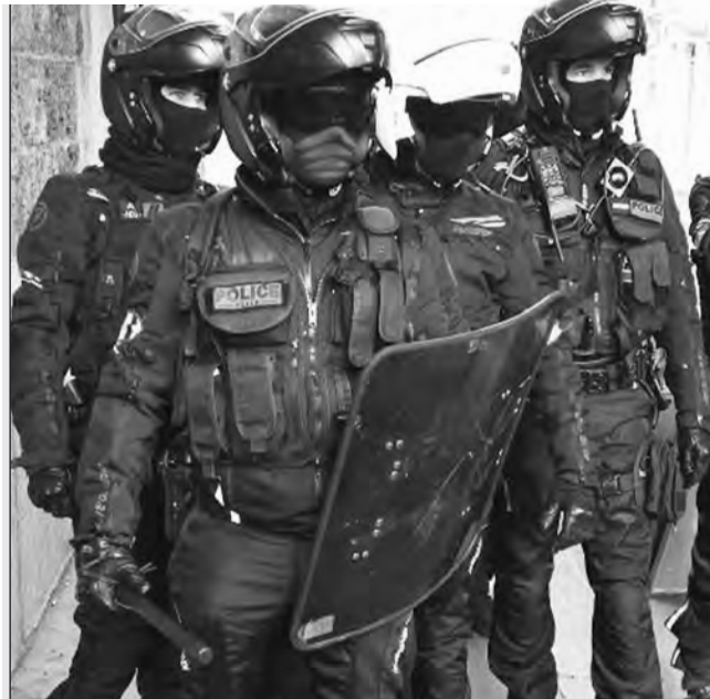
Το γαλλικό κατασταλτικό σώμα BRAV-M

Στις 26 Απρίλη η 3η εξ αναβολής δίκη των 62 αγωνιστών, συλληφθέντων της 6ης Δεκέμβρη του '20