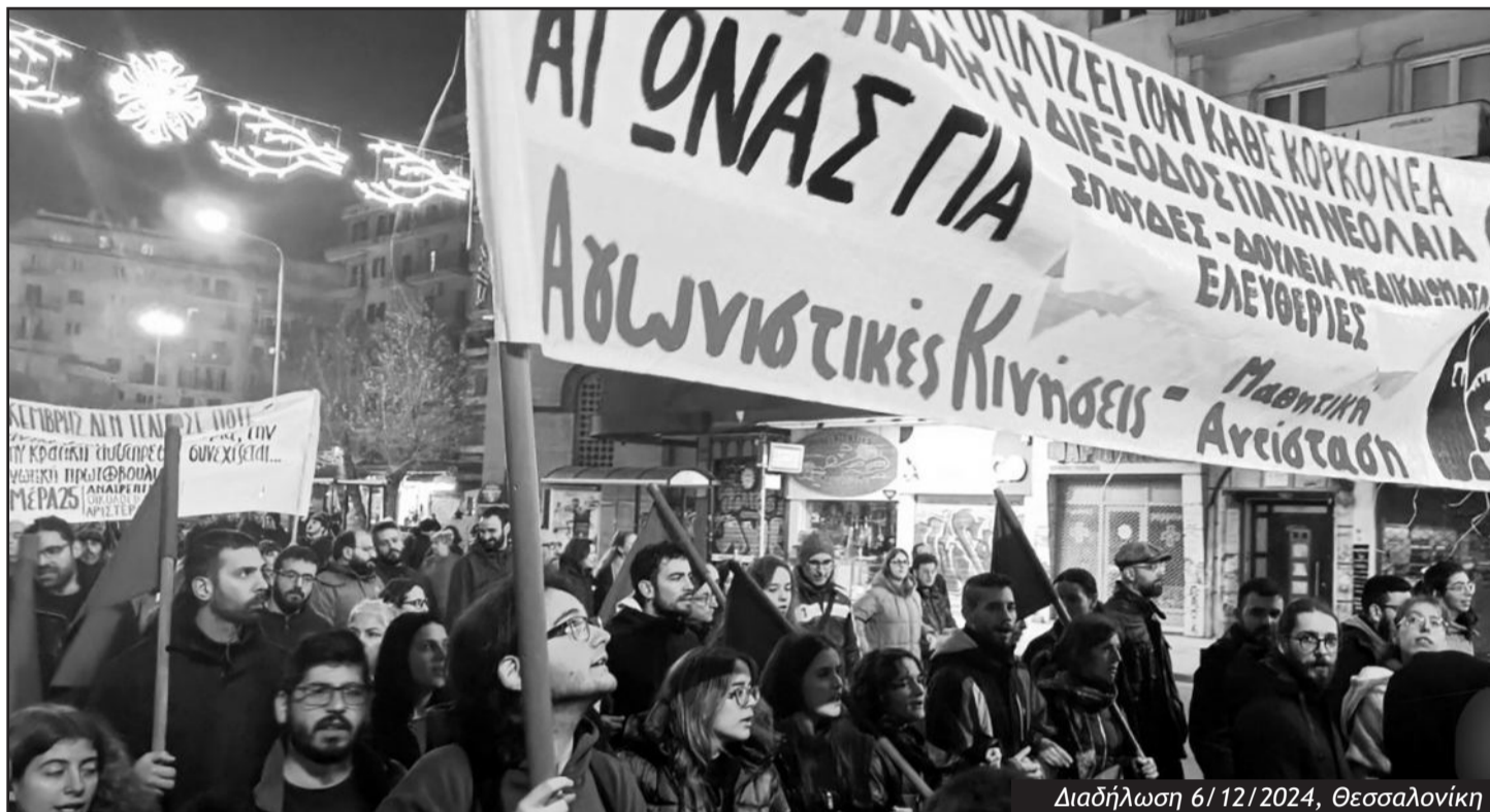
Διαδήλωση 6/12/2024, Θεσσαλονίκη

Στην πρωινή διαδήλωση που πραγματοποιήθηκε στην Αθήνα συμμετείχαν κά-