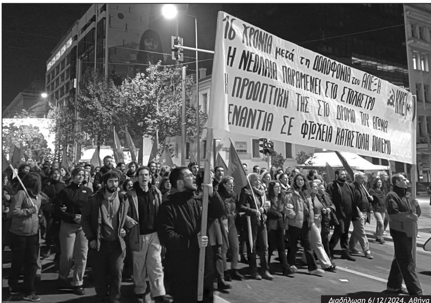
Διαδήλωση 6/12/2024, Αθήνα

Οι μαζικές διαδηλώσεις και με το έντονο στοιχείο της νεολαίας που πραγματοποιήθηκαν σε μια σειρά πόλεις της χώρας δείχνουν ότι η νεολαία δεν ξεχνά την εξέγερση του Δεκέμβρη του '08. Δείχνουν ότι η νεολαία, που συνεχίζει και ασφυκτιά από την πολιτική που τσακίζει τα δικαιώματά της, θα βγαίνει στους δρόμους, θα διαδηλώνει και θα εναντιώνεται στην πολιτική του συστήματος. Η οργή που έχει συσσωρεύσει η νεολαία χρειάζεται να μεταφραστεί σε συλλογικούς και οργανωμένους αγώνες, για να κερδίσει τις μάχες της γενιάς της.