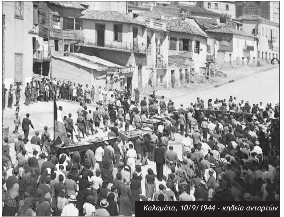
Καλαμάτα, 10/9/1944 - κηδεία ανταρτών

Βλέπουμε, όμως, ότι η πρόθεση των ΕΛΑΣιτών ήταν να μην οδηγηθούν σε σύγκρουση, αλλά να επιδιώξουν την παράδοση των αντιπάλων τους. Να σημειώσουμε εδώ ότι είχε προηγηθεί το Συνέδριο του Λιβάνου τον Μάη του ίδιου έτους με την υποχώρηση του ΕΑΜ και η συμμετοχή ηγετικών στελεχών του ΚΚΕ στην κυβέρνηση Γ. Παπανδρέου (Εθνικής Ενότητας) από τις 2 Σεπτεμβρίου. Αυτός είναι και ο λόγος που η κυβέρνηση Πα-