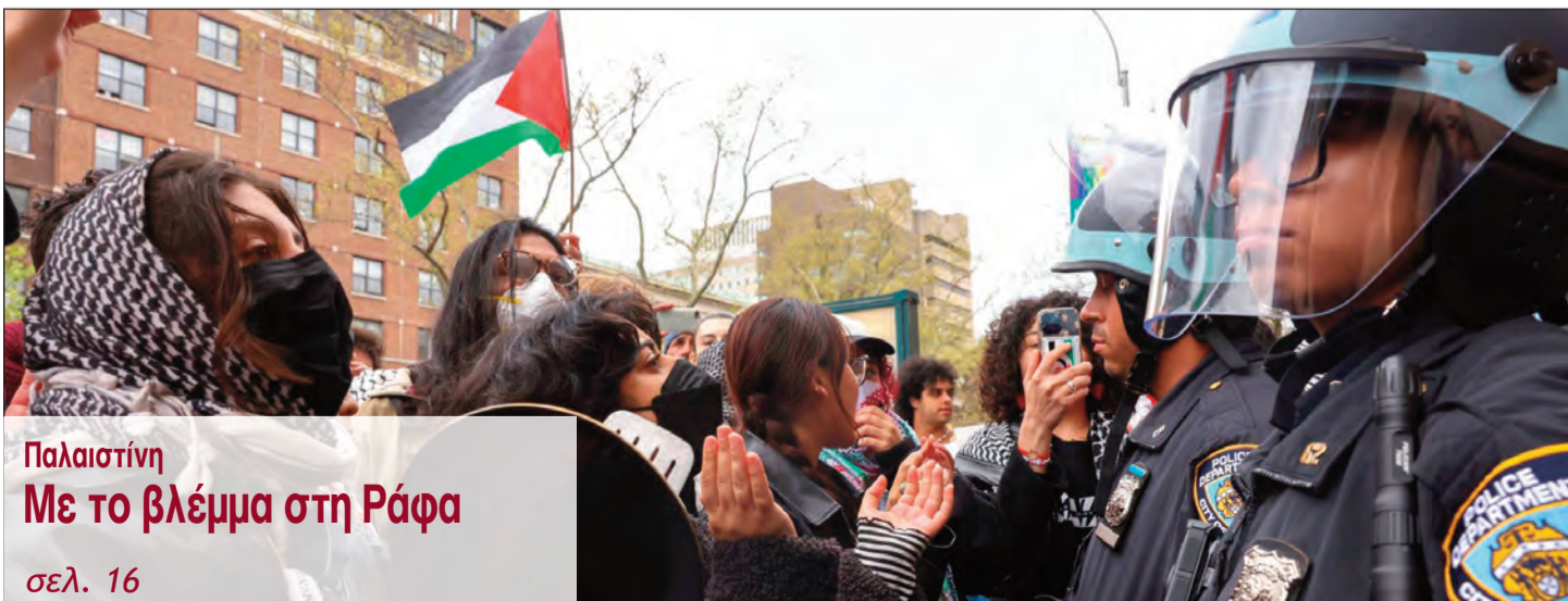
Παλαιστίνη Με το βλέμμα στη Ράφα