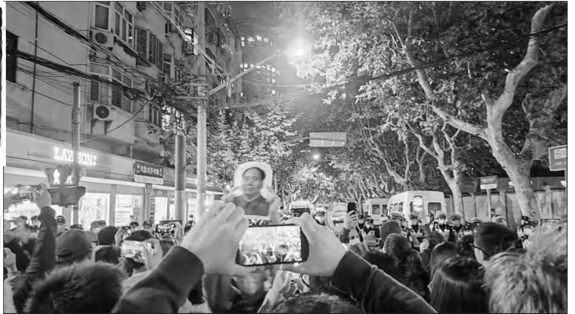
Κινητοποίηση φοιτητών στο Πεκίνο στην οποία ανάμεσα στις λευκές σελίδες εμφανίστηκαν φωτογραφίες του προέδρου Μάο!