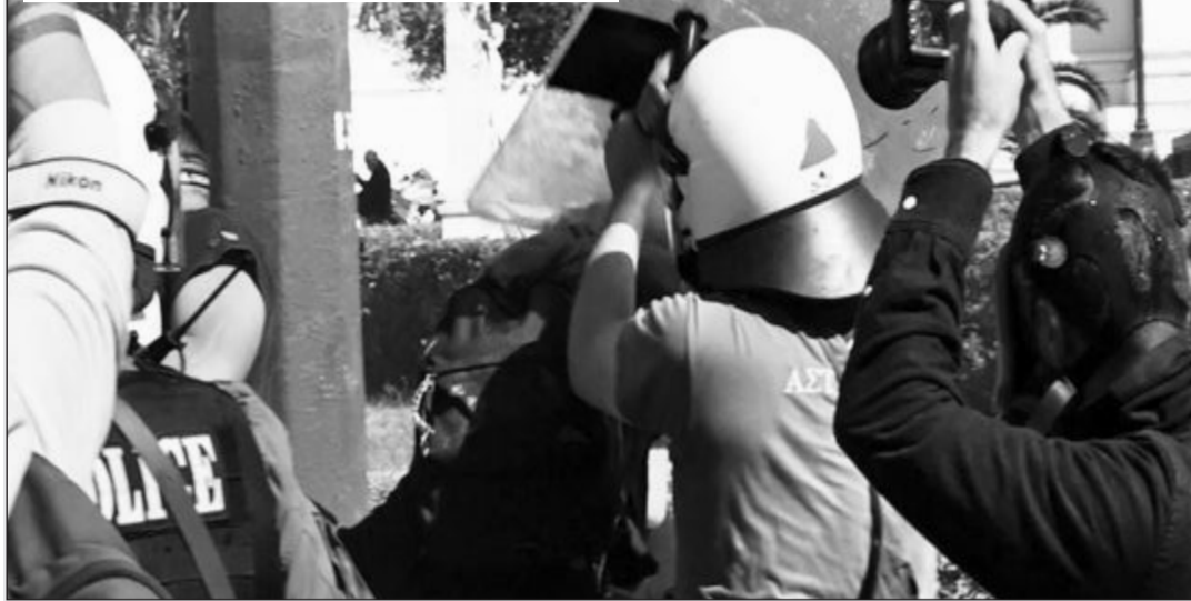
Αστυνομικός των ΜΑΤ χτυπά φοιτήτρια με την ασπίδα του