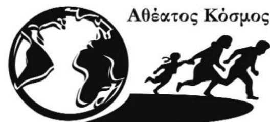
γράφει ο Δημήτρης Παυλίδης

Ο Μελανσόν (επικεφαλής της Ανυπότακτης Γαλλίας) δήλωσε ότι «ο διορισμός του Μπαρνιέ είναι πρακτικά μια κυβέρνηση του Μακρόν μαζί με τη Λεπέν. Ο διορισμός του Μπαρνιέ δείχνει ότι το αποτέλεσμα των εκλογών δεν είναι γαλλικό κοινοβούλιο έχει κλαπεί». Το ΝΑΜ ήδη έχει καλέσει τον κόσμο σε διαδηλώσεις στους δρόμους στις 7 Σεπτεμβρίου.