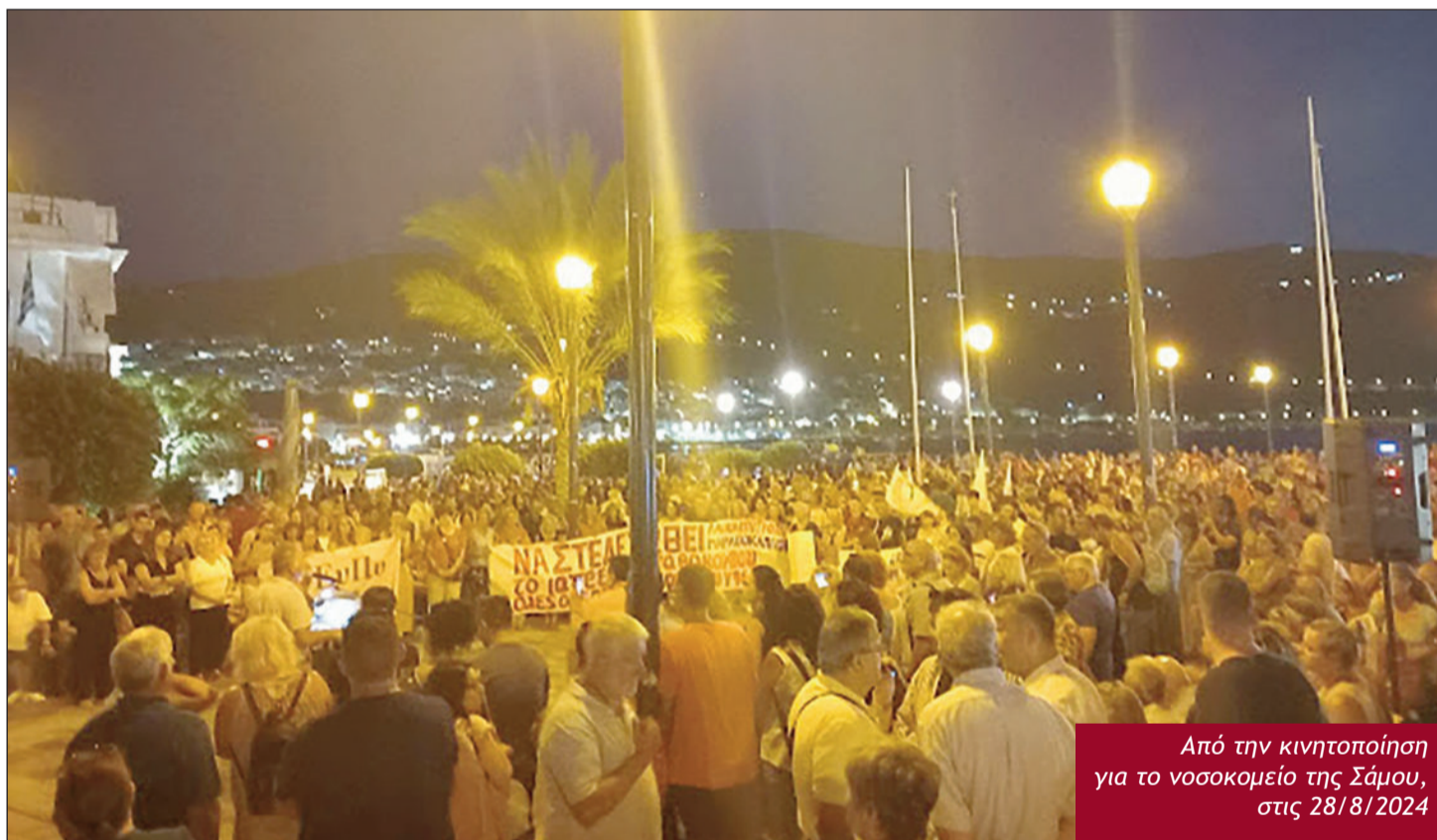
Από την κινητοποίηση για το νοσοκομείο της Σάμου, στις 28/8/2024

Να συγκροτήσουμε αυτό που “λείπει” για την αντίσταση του λαού