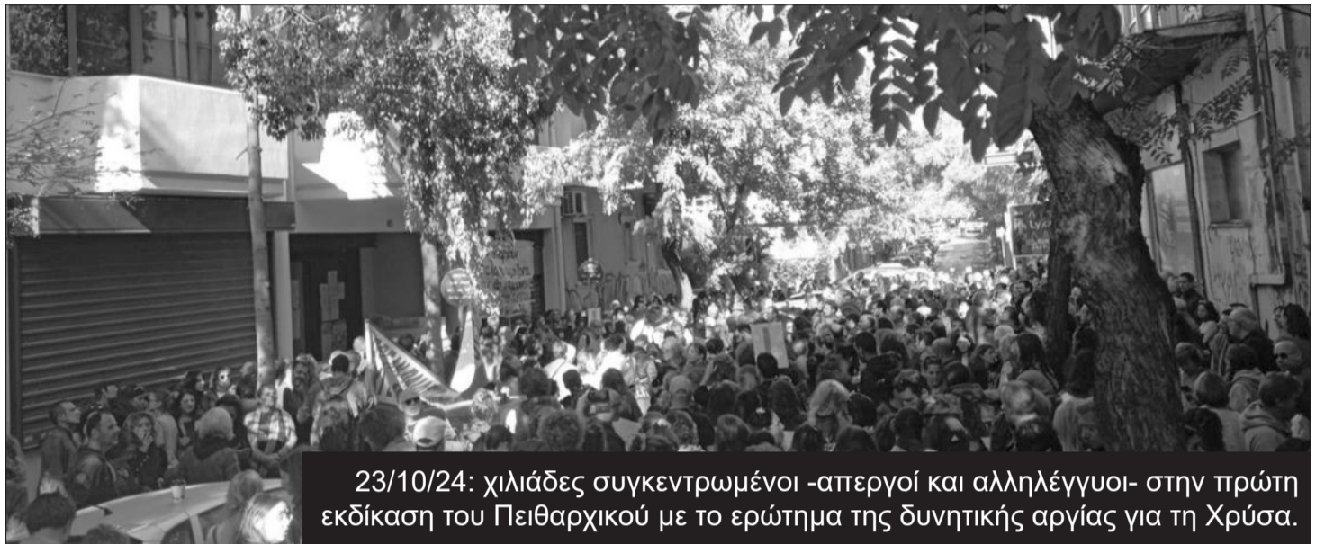
23/10/24: χιλιάδες συγκεντρωμένοι -απεργοί και αλληλέγγυοι- στην πρώτη εκδίκαση του Πειθαρχικού με το ερώτημα της δυνητικής αργίας για τη Χρύσα.

νά (όπως στις 23/10/24) χιλιάδες απεργιοί και αλληλέγγυοι, που θα απαιτήσουν να γυρίσει η Χρύσα στο σχολείο!