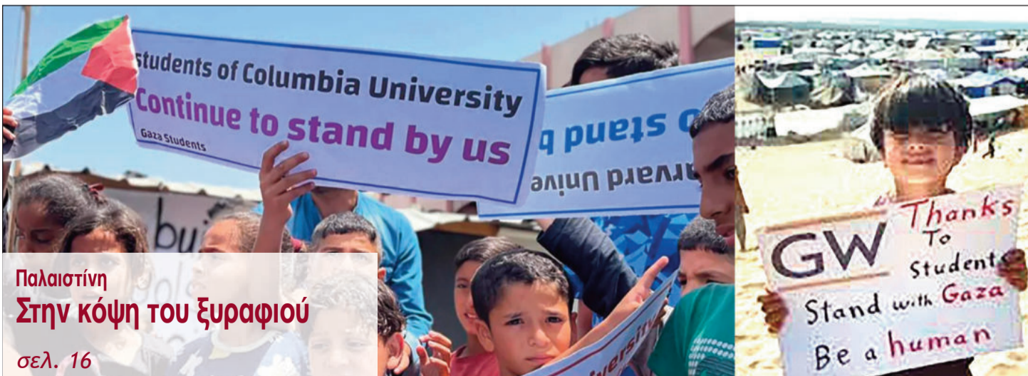
Παλαιστίνη Στην κόψη του ξυραφιού σελ. 16

Κύμα φοιτητικών καταλήψεων σε όλο τον κόσμο υπέρ της Παλαιστίνης σελ. 10-11