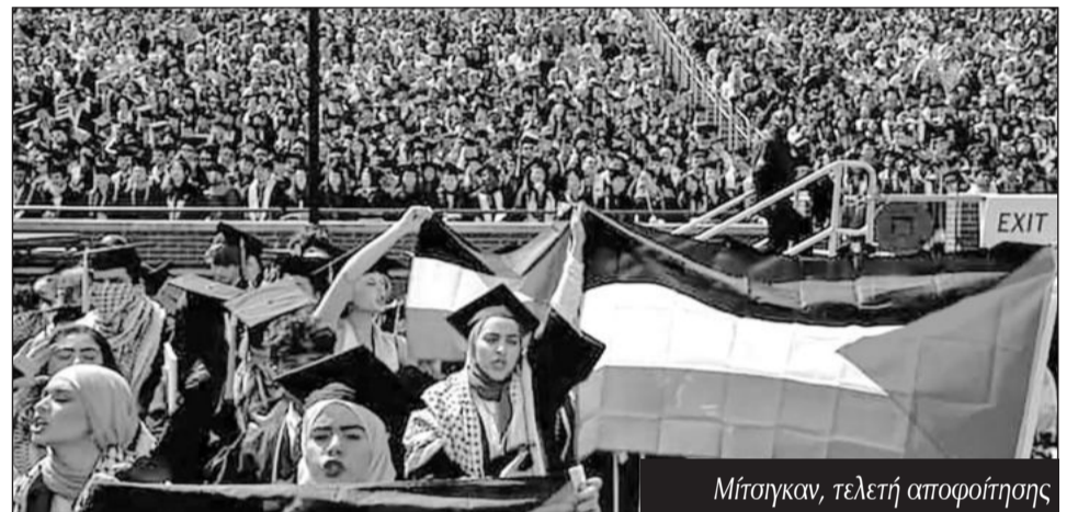
Μίσιγκαν, τελετή αποφοίτησης

1948 είναι ασυναγώνιστος. Ωστόσο, η σχετική αποδυνάμωση της παγκόσμιας επιρροής των ΗΠΑ έχει θέσει εδώ και καιρό ζητήματα τακτικής και διαχείρισης των ισορροπιών στη Μέση Ανατολή, που ενισχύουν την ενδοαστική κόντρα.