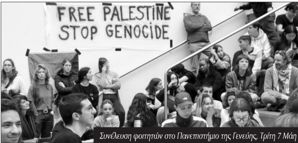
Συνέλευση φοιτητών στο Πανεπιστήμιο της Γενεύης, Τρίτη 7 Μάη

μαθήματα διαδικτυακά, ενώ δεν έλειψαν και οι απειλές για διακοπή της χρηματοδότησης στο ίδρυμα για το διάστημα που διαρκούν οι κινητοποιήσεις.