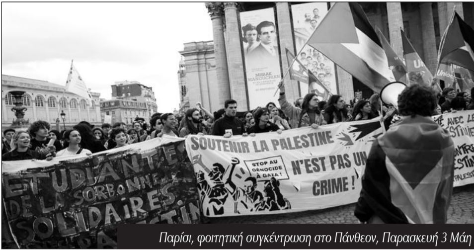
Παρίσι, φοιτητική συγκέντρωση στο Πάνθεον, Παρασκευή 3 Μάη