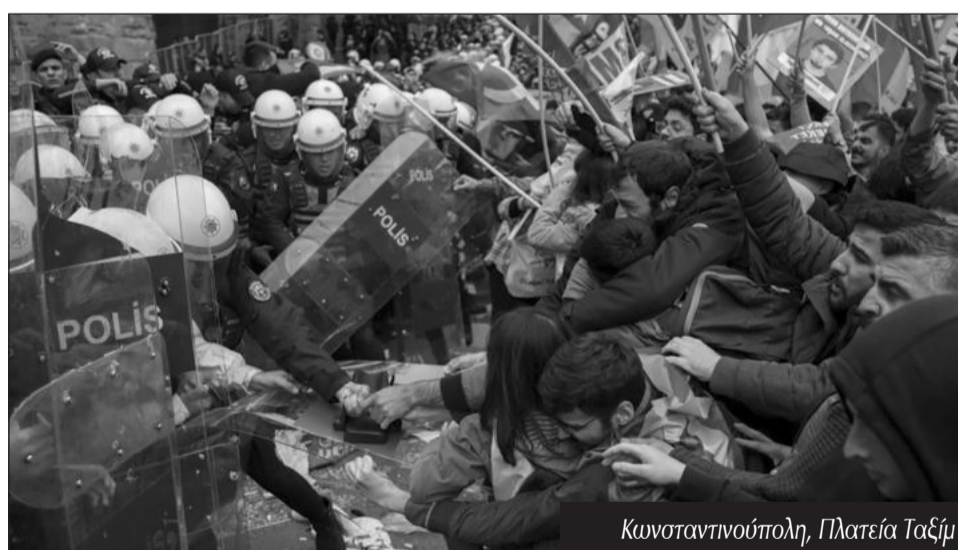
Κωνσταντινούπολη, Πλατεία Ταξίμ

Οι χιλιάδες διαδηλωτές στη Σεούλ είχαν σαν κεντρικό αίτημα την κατάργηση ▶